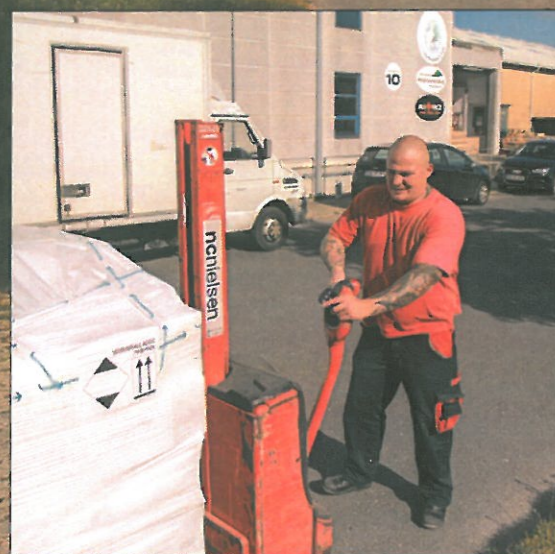
En forretning i det nordjyske får leveret en palle med hårprodukter.